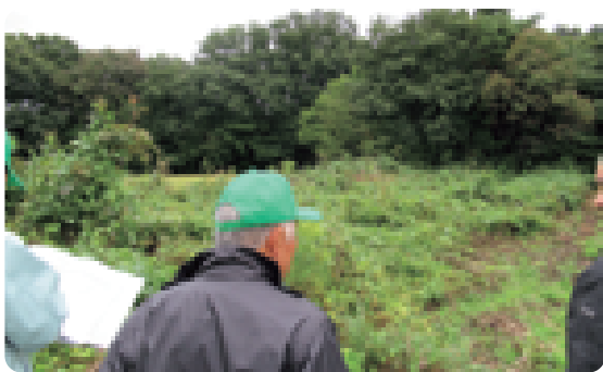
農地パトロールの様子

このことから、農業委員会では農地パトロール(利用状況調査)を年1回実施し、地域の農地利用の確認、遊休農地の実態把握と発生防止・解消対策、さらに農地の違反転用の発生防止に重点的に取り組んでいます。