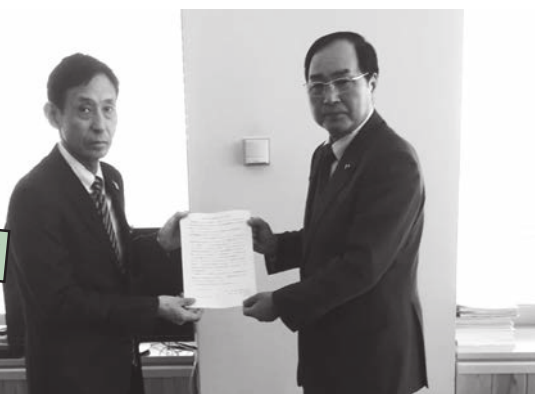
3/25 栃木県庁にて意見書提出