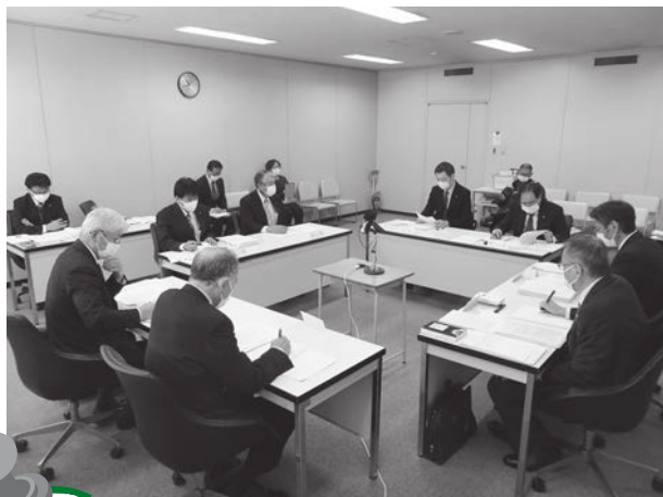
3/6 民生文教常任委員会