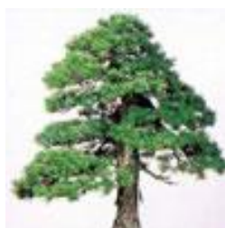
◇町の木 ゴヨウマツ