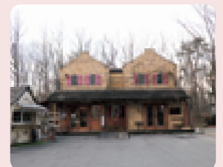
ロイヤルロード(県道21号線)沿いに似合うかわいらしい洋館風の建物です