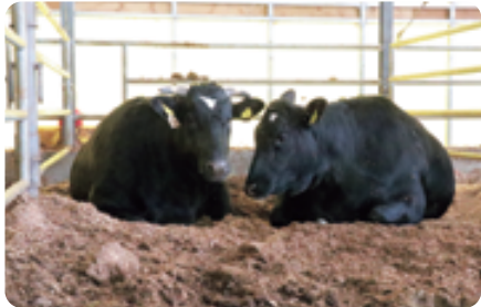
牛に優しい管理。ゆったりとしたスペースを確保し、毎日規則正しい給餌と適宜清掃作業をしています