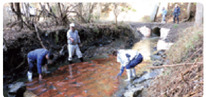
毎年恒例、道の駅東山道伊王野で提供する寒晒そば用のソバの実900Kg(約5,000食分)を川に浸しました。冷水に浸すことでソバの実のあくが抜け糖분을蓄えるため、甘みのあるそばができます。寒晒そばまつりは2月8日(土)~16日(日)に開催されます(1/9 三蔵川源流)