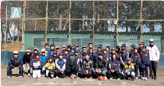
町内の小中学生と指導者40人がワイルド・ボアーズの選手らから、投球・打撃などを教わりました(12/8 中央運動公園 ジュニアソフトボール教室)

「止まってくれない！栃木県」脱却PR大使の創造戦士トチエーター、クロロ、とちまるくん、県警マスコットキャラクターのルリちゃんに応援にきてくれました