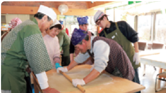
そばの里伊王野愛好会の協力のもと、利用者11人がそば打ちを体験。そばの良い香りに包まれながらみんなで楽しく打ちました(1/21 りんどう作業所)