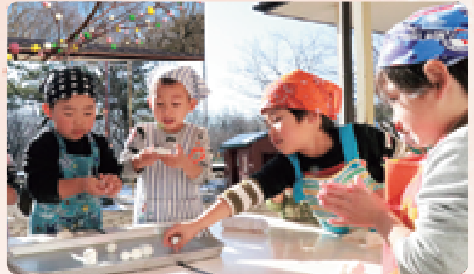
年少中長(みかん組、りんご組、めろん組)45人の園児が、病気にならないようにと心を込めてとんぼだんごを作りました(1/14 那須高原保育園)