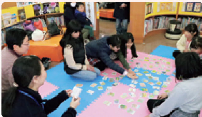
「那須かるた」には、郷土を知る情報が盛りだくさん。和やかな雰囲気の中、行われました(1/18那須かるた大会 図書館)