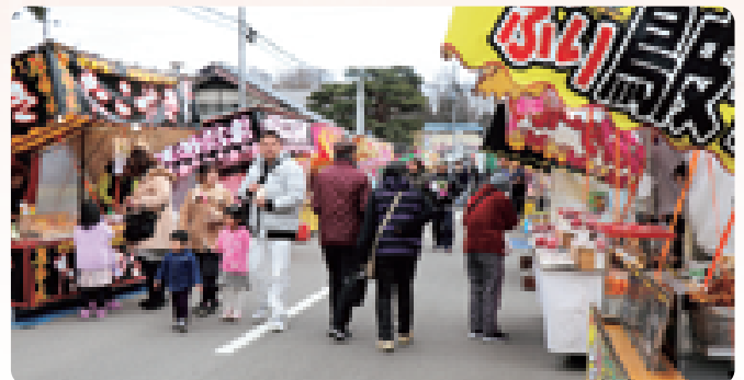
寒風の吹く中、訪れた方たちは大判焼や縁起物のだるまなどを購入していました。また、温かいだっばら汁なども振舞われました(1/18黒田原初市 役場前通り)