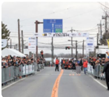
第2回ツール・ド・とちぎ那須町コース会場の様子

▼大迫力のゴール地点。さまざまなブースや、実況解説も聞き取ることができ、なんとと言っても大迫力のゴールの瞬間は必見です。