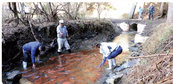
毎年恒例、道の駅東山道伊王野で提供する寒晒そば用のソバの実900Kg(約5,000食分)を川に浸しました。冷水に浸すことでソバの实のあくが抜け糖分を蓄えるため、甘みのあるそばができます。寒晒そばまつりは2月8日(土)~16日(日)に開催されます(1/9 三蔵川源流)