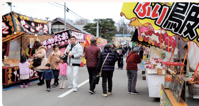
寒風の吹く中、訪れた方たちは大判焼や縁起物のだるまなどを購入していました。また、温かいだっばら汁なども振舞われました(1/18黒田原初市 役場前通り)