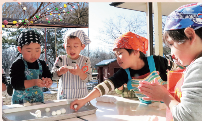
年少中長(みかん組、りんご組、めろん組)45人の園児が、病気になるないようにと心を込めてとんぼだんごを作りました(1/14 那須高原保育園)