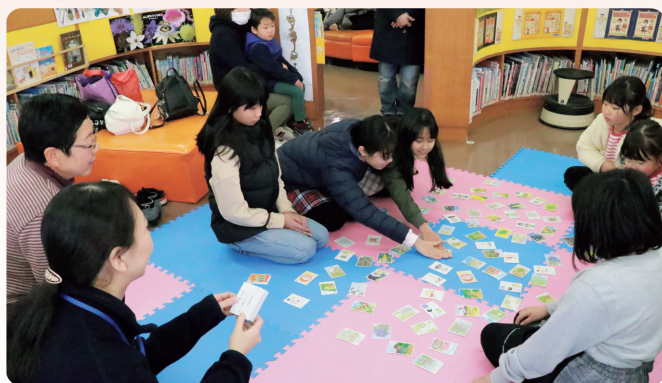
「那須かるた」には、郷土を知る情報が盛りだくさん。和やかな雰囲気の中、行われました(1/18那須かるた大会 図書館)