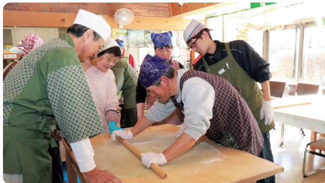
そばの里伊王野愛好会の協力のもと、利用者11人がそば打ちを体験。そばの良い香りに包まれながらみんなで楽しく打ちました(1/21 りんどう作業所)