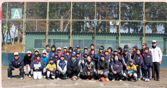
町内の小中学生と指導者40人がワイルド・ボアーズの選手らから、投球・打撃などを教わりました(12/8 中央運動公園 ジュニアソフトボール教室)

「止まってくれない！栃木県」脱却PR大使の創造戦士トチエイター、クロロ、とちまるくん、県警マスコットキャラクターのルリちゃんに応援にきてくれました