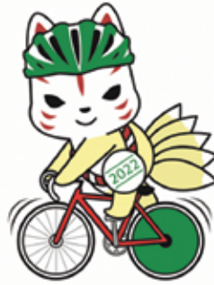
自転車ロード・レース

那須町観光大使のきゅーびーがいちご一会とちぎ国体とコラボレーションし、町で開催する自転車競技(ロード・レース)とデモンストラティオンスポーツ(エアロビック)を盛り上げます。