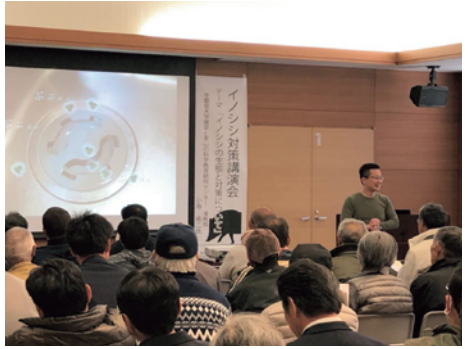
那須町認定農業者の会と共催したイノシシ対策講演会