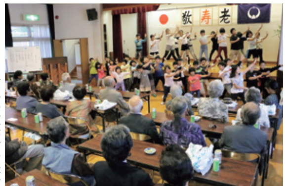
▶昨年の敬老会の様子