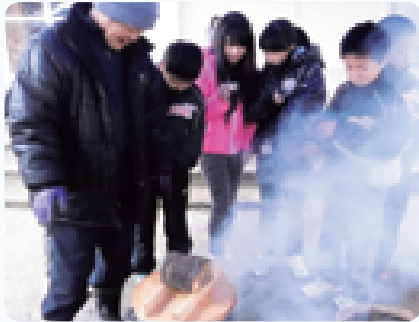
炊出し体験（東陽小学校）

また、部活動がない水曜日の放課後や、授業がない夏休みに利用して実施する「放課後子ども教室」「サマースクール」などの取り組みも広