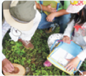
平ちゃん先生の自然教室（田代友愛小学校）

通学路の危険箇所を確認してハザードマップを作ったり、独居老人宅を把握して福祉マップを作ったり……、地域学校協働活動の成果には大きな期待が寄せられています。