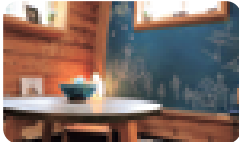
黒板はお絵かき自由。外にはブランコとハンモックがあり、大人も子どもも楽しめます