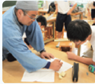
水曜講座（那須中学校）

がっています。地域の皆さんの専門性を生かして、子どもたちの豊かな体験の場を作るとともに、安心して過ごせる居場所をつくることにつなげていきます。