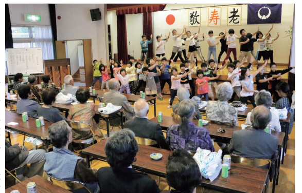
▶昨年の敬老会の様子