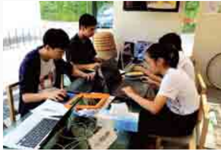
ジュニア学芸員の活動の様子

○公民館企画事業 町内4つの公民館では、地域住民を対象として、指導者育成、学びの場づくりのためのイベントやワークショップを開催します。