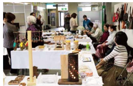
▲個性あふれる作品が勢ぞろい。ふれあい工房が役場町民ホールで作品展を開き、丁寧に作った木工作品や小物、陶器などを展示・販売しました（3/22）