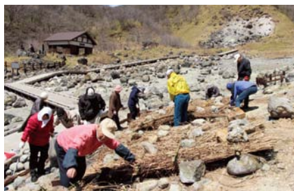
▲今年もゴールデンウィークの前に那須高原湯本ガイドクラブの皆さんによって殺生石のしめ縄の交換（4/8）と湯の花畑の屋根（かや）の修復（4/15）が行われました