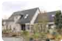
お店は四季折々の花木に囲まれています