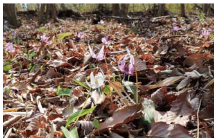
▲早春の山を可憐に彩るカタクリの花の群生。薄紫色の中に珍しい白いカタクリの花を見つけました（4/18 大深堀）

この日は、キャンペーンのスタートをさらに盛り上げるため、那須町、観光協会、各観光施設が協力して観光PRを行いました。「御用邸のある那須町でも様々な特別企画をご用意しておりますので、ぜひ、カップルやご家族連れで那須へお越しください」と平山町長があいさつしました。多くの人が行き来する大宮駅西口イベント広場で、那須の高原アスパラの無料配布、ホテルのペア宿泊券などが当たる抽選会、ゆるキャラ写真撮影会などを行い、那須の魅力をアピールしました。