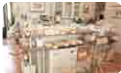
クッキーなどの焼菓子や、ジャムなどは手作りで