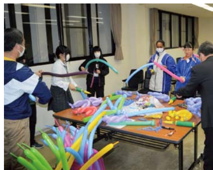
スキルアップ研修 (バルーンアート作成)

ページ、各中学校にあります。 ▼締切り 5月31日(金) ▼申込み・問合せ 生涯学習課 生涯学習係 ☎726923