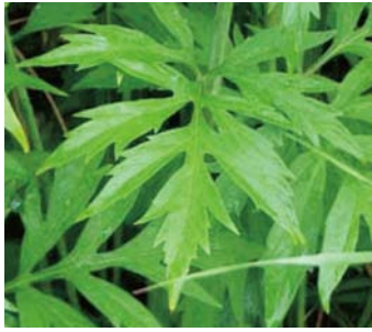
オオハンゴウソウ花と葉