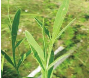
オオキンケイギク花と葉