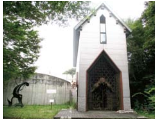
平成29年12月まで美術館として営業