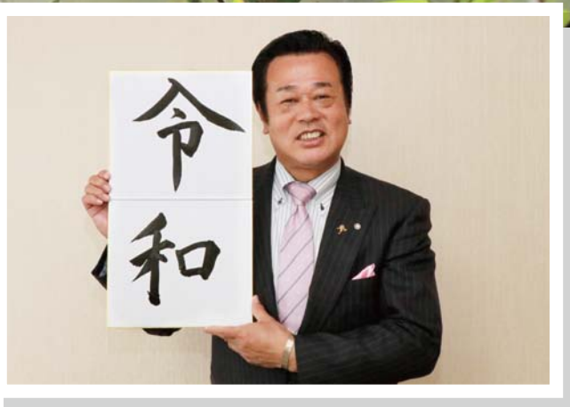
那須町長 平山 幸宏

元号は時代を区切り、その時代を生きる私たちの心に深く根を下ろします。5月1日に皇太子殿下が天皇に即位され、新たな時代が