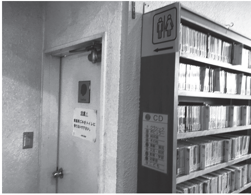
図書館の狭いトイレ入口