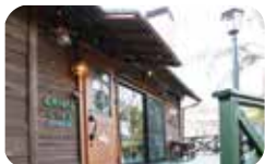
大きな煙突とウッドデッキが目印です。