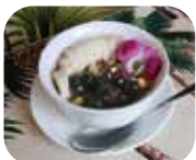
デザートには栄養満点のアサイボウルがおすすめ。