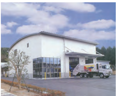
クリーンステーション那須