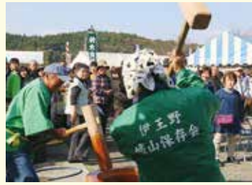
元気な掛け声に行列ができました。収穫大感謝祭でも、つきたてお餅は大人気でした。(11/11 道の駅東山道伊王野)