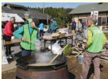
奥州道芦野まつりを開催。地元の野菜をふんだんに使った豚汁に心も体も温まりました。(11/11 遊行庵直売所)