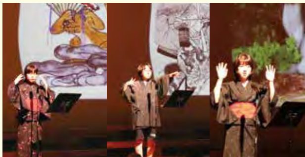
身振り手振りで話を表現