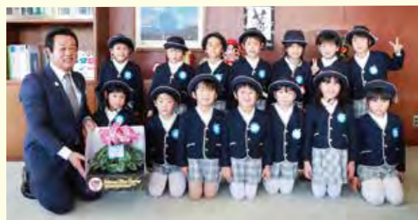
勤労感謝の日を前に、那須幼稚園桜組14人の園児から「いつもお仕事お疲れさまです」の言葉とともにシクラメンをいただきました。(11/21 町長室)