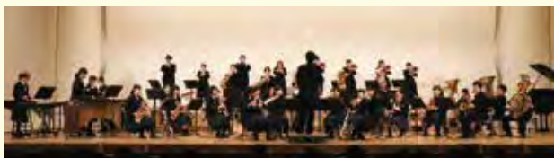
那須中学校・那須中央中学校が合同で演奏