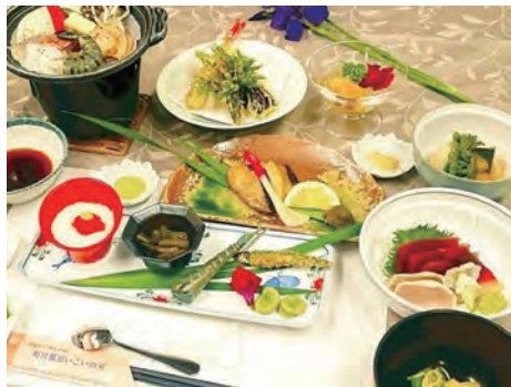
季節の食材を使った自慢の和食膳