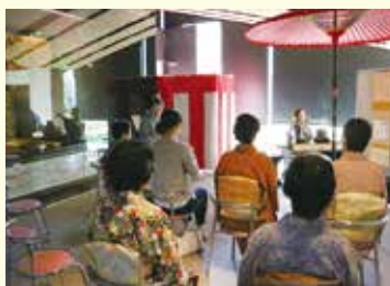
特別展「能の世界」の展示を愛でながら、町文化協会茶道部によってお茶が振舞われました。(11/11 那須歴史探訪館)