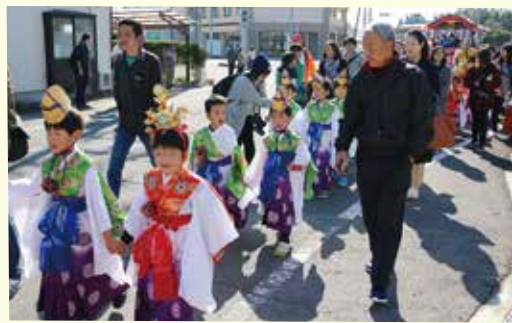
来春、黒田原小学校に入学する子どもたちが装束を身に付け黒田原地内を練り歩きました。(11/3 黒田原神社例大祭 稚児行列)