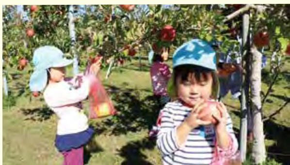
真っ赤に実ったリンゴを収穫。食べるのが楽しみだね。 (10/30 伊王野保育園リンゴ狩り 大野りんご園)