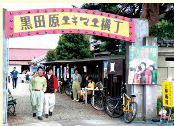
昭和レトロの雰囲気にもまれ開催されました。映画上映のほか、トークショーなどの楽しいイベントも催され大盛況でした。(10/7 黒田原駅前ナスタジック映画祭)