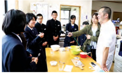
食レポではフレッシュチーズを豆腐のような触感と表現しました（那須高原今牧場）

先月に引き続き2回目と3回目のワークショップが各中学校で行われました。2回目のワークショップではインタビュ어의ポイントを学び、那須中では職員室で、那須中央では役場で中継リポートに挑戦。生徒たちは「現場で見たものをどう言葉で伝えるか悩んだ」「緊張してなかなか質問できなかった」と現況を説明する難しさを振り返りました。