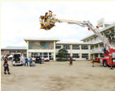
はしご車による黒田原小学校屋上からの負傷者救出救助訓練

このほか、展示ブースではドローンの展示や、停電時の電源対策、災害時用伝言ダイヤル体験なども行われました。訓練後、平山町長から「町民の皆さまが安全で安心して暮らせるようなまちづくりを推進するため、努力していきたい」との講評がありました。