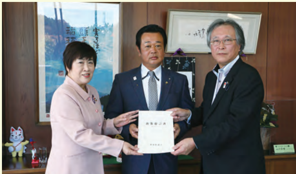
町議会から町長に政策提言書が提出されました。町と議会がともにより良いまちづくりに取り組みます。 (10/30 町長室)