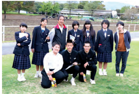
牛についているいる教えてくれました（MANIWA FARM）

たことを素直にラジオで話してほしい」と期待していました。中学生たちは20日の取材の内容をもとに、11月11日、エフエム栃木のスタジオで生放送に挑戦します。ぜひ、お聞きください。