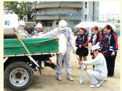
上下水道課職員と婦人防火クラブ連絡協議会による応急給水訓練