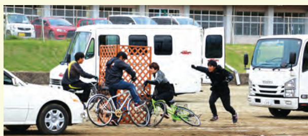
スタントマンが交通事故を再現。生徒たちに事故に遭う危険性や交通安全に対する意識を持つことの重要性を伝えました。 (9/26 那須中 スクエア・ストレイト方式の交通事故模倣体験交通安全教室)