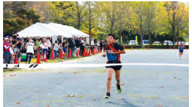
小学生の部 優勝 東陽 A