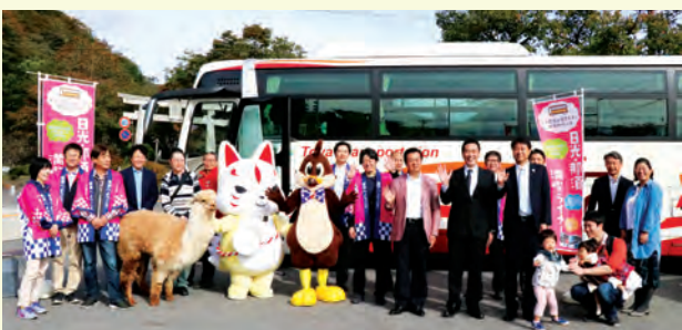
秋を満喫。バスに乗って紅葉前線へ。目線の高いバスの車窓から秋の絶景を堪能しました。 (10/13 那須湯本温泉 日光・那須満喫ライナー出発式)