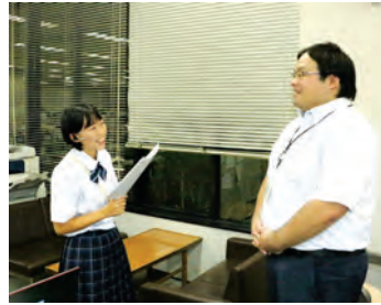
10/5 税務課の職員に仕事のやりがいについてインタビューしました

先月に引き続き2回目と3回目のワークショップが各中学校で行われました。2回目のワークショップではインタビュ어의ポイントを学び、那須中では職員室で、那須中央では役場で中継リポートに挑戦。生徒たちは「現場で見たものをどう言葉で伝えるか悩んだ」「緊張してなかなか質問できなかった」と現況を説明する難しさを振り返りました。