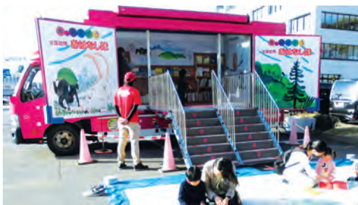
前回の全国訪問おはなし隊のようす