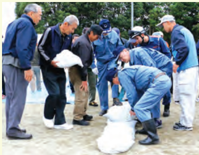
那須町消防団と参加住民による積み土のう工法訓練