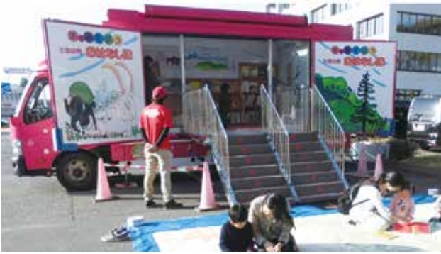
前回の全国訪問おはなし隊の様子