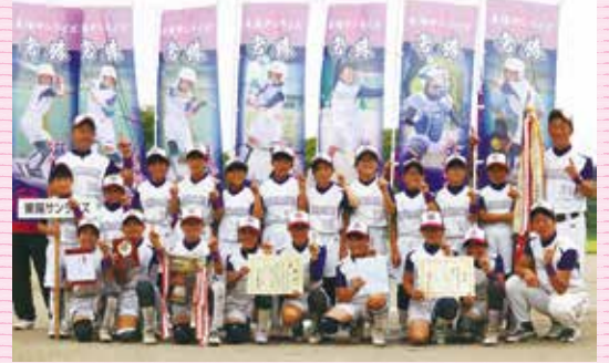
▲県大会3連覇の東陽サンライズ