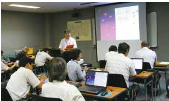
昨年の「おとプロ」のようす