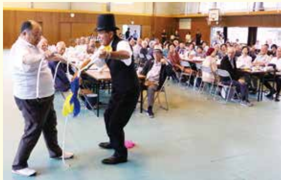
マジックショーで盛り上がり、会場は驚きと笑いに包まれました(9/9 田中地区)

75歳以上の敬老者を招待し、18地区社会福祉協議会と5つの高齢者施設で敬老会を開催しました。