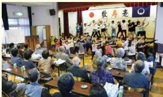
那須小の児童がNASU OND(那須音頭)を元気いっぱい踊ってくれました(9/19 湯本地区)