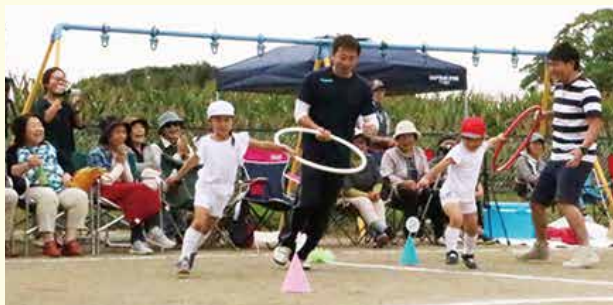
(ひまわり組親子競技: いきをあわせて、レッツゴー)

風の中にも秋の気配を感じる季節となった9月13日、千振保育園で運動会が行われました。園児たちはこの日のために、毎日競技やパレード、お遊戯をいっしょうけんめい練習してきました。園児たちの勇姿に、家族や地域の方からたくさんのお応援や拍手が送られました。