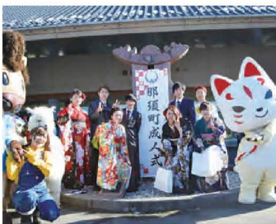
平成30年那須町成人式実行委員の皆さん