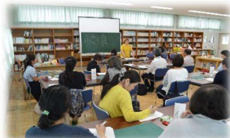
図書ボランティア講座