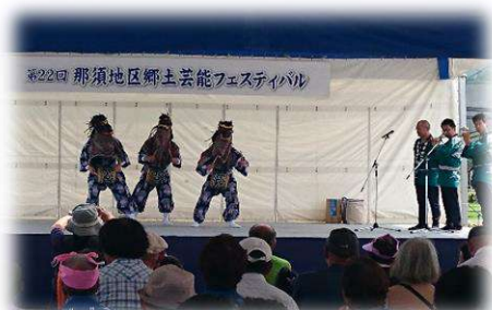
那須地区郷土芸能フェスティバル