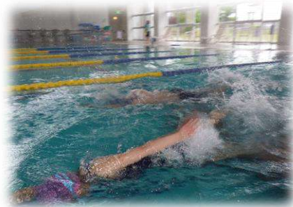
幼児・小中学生水泳教室