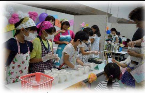
子どもフェスティバル