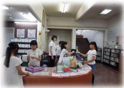
子どもライブラリアン体験