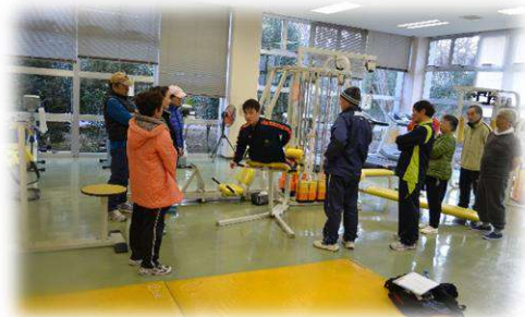
トレーニング教室