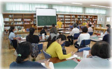
図書ボランティア講座