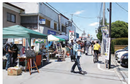
▲昨年の黒田原駅前の様子