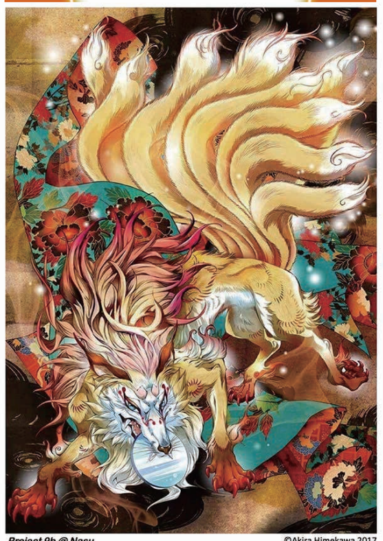
Project 9b @ Nasu