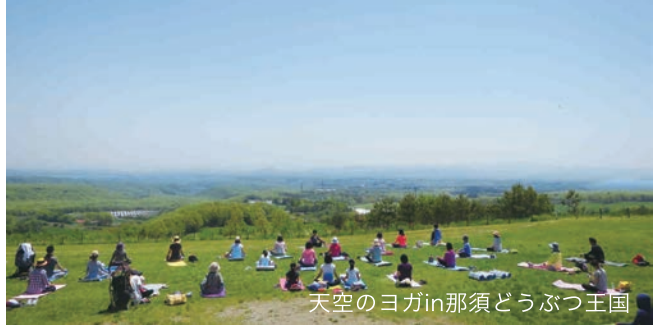
天空のヨガin那須どうぶつ王国