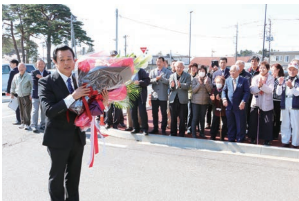
▶初登庁の際は、大勢の町民が役場前に集まりました。

私は、町民の皆さんと同じ目線に立って課題を見つけ出し、皆さんと同じ耳でどんな声も真剣に聴き、皆さんと同じ足で問題が起きている場所へ駆けつけ、皆さんと同じ手で汗まみれになって働き、そしてその手で、町が進むべき道を指し示していきます。夢ある未来へのまちづくりを進めていくために、町民の皆さん、ご理解とご協力をお願いいたします。