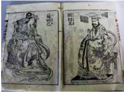
「繪本三国妖婦傳」挿し絵 殷の紂王(右)と妲己(左)

殷国内の冀州には、その統治者蘇護の娘に壽羊(後の妲己)という16歳の娘がいた。容色勝れ、管弦の道や文学筆墨の芸をすべて習得し、世に並ぶ者がなると評判になった。紂王はこれを聞き、献上するよう蘇護に命じる。蘇護はそれを拒んで反乱しようとするが、その非を、岐州の統治者西伯侯姬昌(後の周の文王)に諭され、自ら壽羊を警護しながら都に向かう。