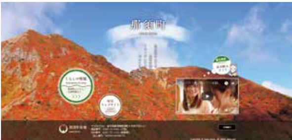
ホームページには四季折々の風景写真を多く取り入れています。