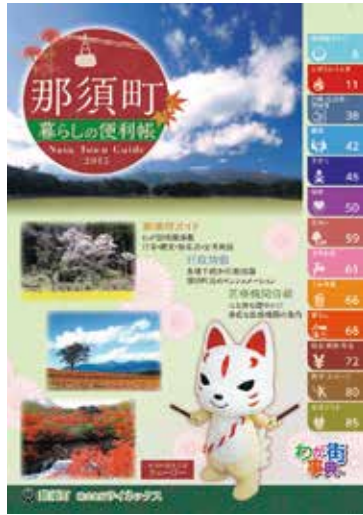
2015年版暮らしの便利帳

町の施設や各種手続などの行政情報、地域の情報を掲載した冊子「暮らしの便利帳」は、平成27年3月に、町と株式会社サイネックスが協働で発行し、各戸に配布しています。このたび、内容の見直しを行い、平成30年5月に改訂版を発行する予定です。