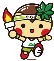
▲大会マスコットとちまるくん(国体版)

▼応募締切り 4月13日(金) ※詳しくは県のホームページをご覧ください。 ▼応募先・問合せ 第77回国民体育大会栃木県準備委員会事務局 イメージソング募集係 ☎028-623-3522 FAX028-623-3527 http://www.pref.tochigi.lg.jp/ml1/kokutai77th.html