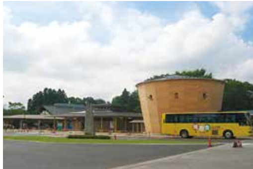
道の駅那須高原友愛の森