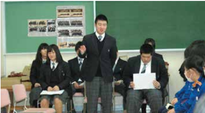
那須高生による研究発表の様子(1/22那須中学校)

1月22日、那須高校の教員と生徒が那須中学校に向向き、出前講座と研究発表を行いました。 リゾート観光科の生徒4名からは「那須高校観光プランについて」と題して、JR「駅からハイキング」に参加協力した際の内容や感想などの発表がありました。 中学生からは「高校生は地域貢献を実施していてさすがだと思った」「卒業生の多くが就職先を地元を選び、地域で活躍していることが分かった」といった感想がありました。 この取組みは1月26日に那須中央中学校でも行われ、町内の高等学校と中学校が交流を図り、理解を深める良い機会となりました。