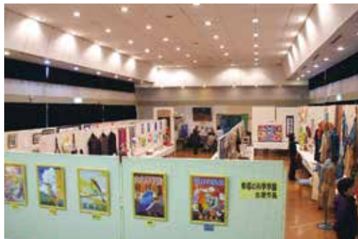
伊王野公民館の文化祭