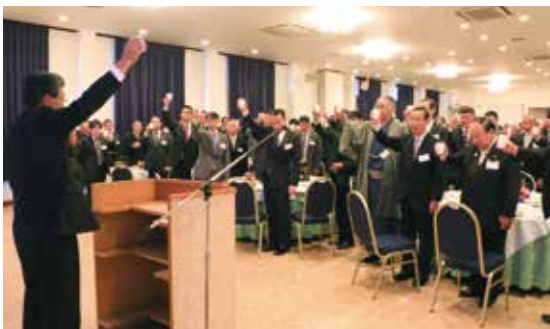
乾杯は、消費拡大を図るため牛乳で行われました。

懇談会では主催団体を代表して町長があいさつし、今後の町施策や取組みについて「行政だけではなかなか達成できるものではない。懇談会参加者はもとより、それぞれの会社、職場、組織、地域そして家庭などにおいても協力をお願いしたい。また、県をはじめ国や他市町との連携や本町の経済界である商工会、観光協会、那須野農業協同組合、森林組合の力強い協力が不可欠であることから、『チーム那須』として団結していきたい」と述べました。