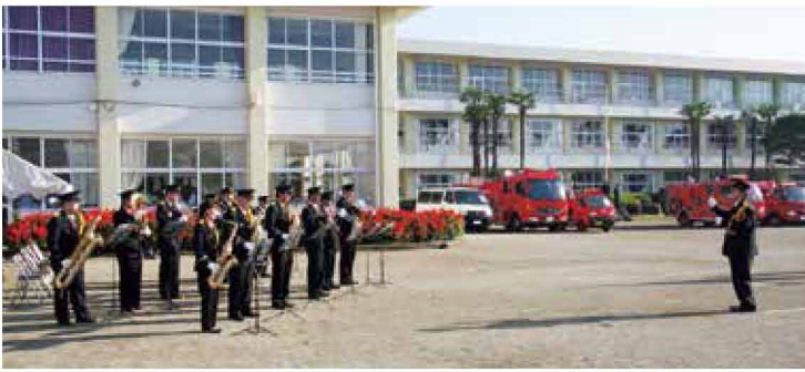
那須町消防団音楽隊では女性も活躍しています。