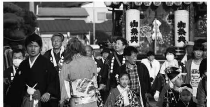
今年も伊王野温泉神社付け祭りが盛大に開催されました。(11/2 伊王野地内)