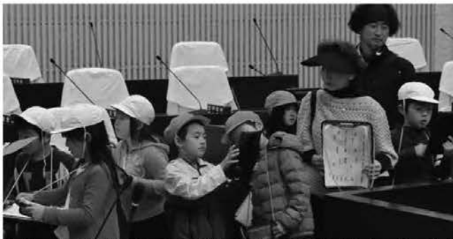
タブレットで講堂を撮影。黒田原小学校2年生7名が庁舎見学に来てくれました。(11/1 役場庁舎)