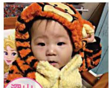
深山 あやな 彩愛 (下町)