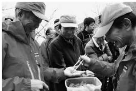
冬山の安全を祈願した後は供え物の赤飯や煮物が振舞われ、大自然に感謝しながらいただきました。(11/8 那須岳開山祭)