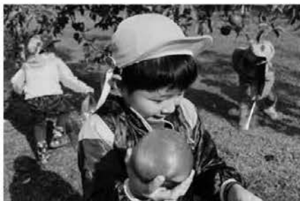
大きくて真っ赤なリンゴがとれました。(11/2 大同保育園りんご祭り)