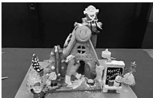
パティシエを講師に招いた教室を開催しました。クリスマスにぴったりなお菓子の家の完成です。(11/16 那須公民館)