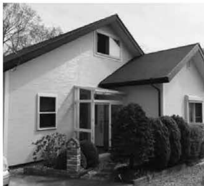
○登録物件⑭ 役場・小学校・スーパー等、徒歩