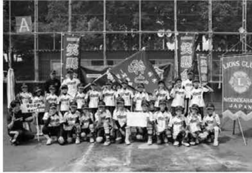
▲優勝した学びの森 SBC