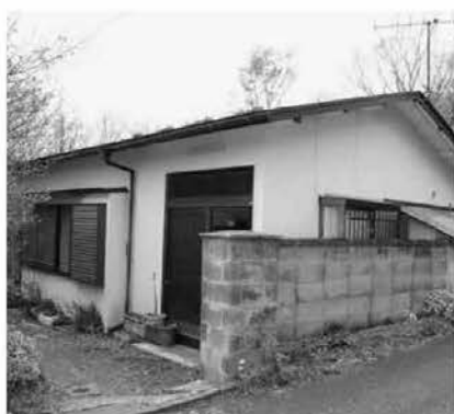
▼問合せ ふるさと定住課定住促進係 ☎72-6955