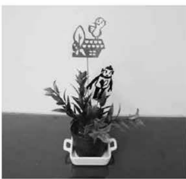
切り絵小物の見本