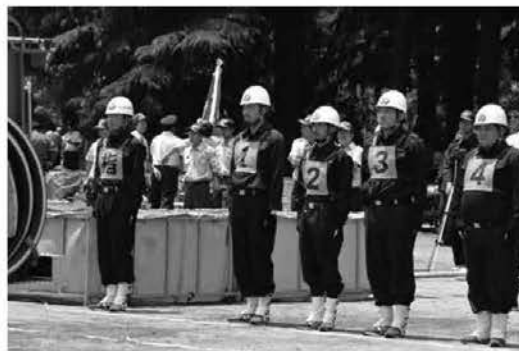
ポンプ車操法の部第4位 第3分団第3部(養沢)選手の皆さん