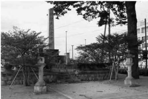
整備された役場前の慰霊塔周辺

8月15日は終戦記念日です。町内では、役場前の慰霊塔および伊王野専称寺境内慰霊塔で、戦没者追悼式が行われます。 参列される方は、11時50分ごろまでに役場前の慰霊塔または伊王野専称寺境内慰霊塔へお越しください。 さきの大戦におけるすべての戦争犠牲者に対し追悼の意を表し、多くの犠牲の上にもたらされた平和への思いを新たにすため、各家庭においても半旗を掲げ、正午のサイレン等に合わせ一分間の黙とうをお願いします。