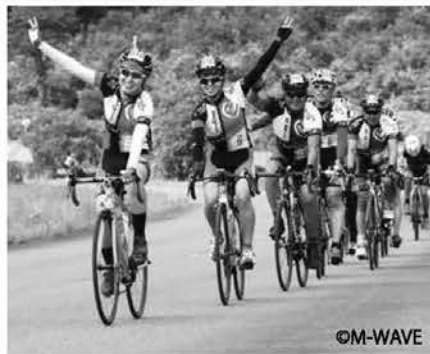
80キロコースが新設され、約2,500人の参加者が那須を満喫(7/10 那須高原ロングライド2016 with那須プラーゼン&宇都宮ブリッツェン)