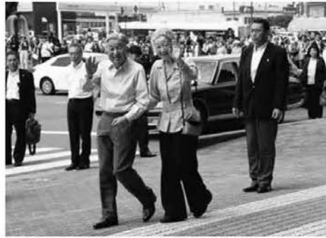
笑顔で手を振る両陛下

天皇、皇后両陛下は、7月25日(月)から28日(木)までご静養のため那須御用邸に滞在されました。 25日正午過ぎ、JR那須塩原駅に到着された両陛下は、集まった約250人の住民らに笑顔で手を