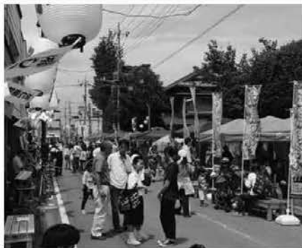
八雲神社例大祭にあわせ、模擬店やステージイベントで盛り上がりました(7/23 黒田原夏まつり 黒田原駅前通り)

楽器や曲の紹介のほか、子どもたちが指揮者になったり、オーケストラと一緒に「妖怪体操第一」を踊ったりと、とても楽しい時間を過ごしました。