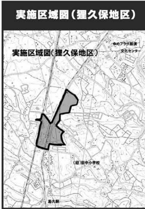
実施区域図（狸久保地区）