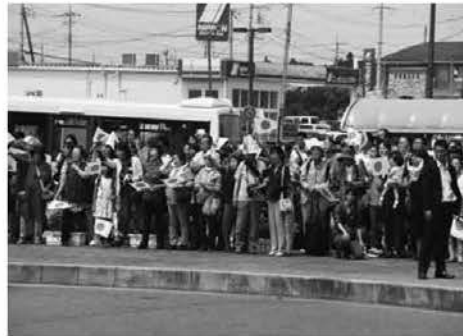
たくさんの人が両陛下をお迎えました

天皇、皇后両陛下は、7月25日(月)から28日(木)までご静養のため那須御用邸に滞在されました。 25日正午過ぎ、JR那須塩原駅に到着された両陛下は、集まった約250人の住民らに笑顔で手を