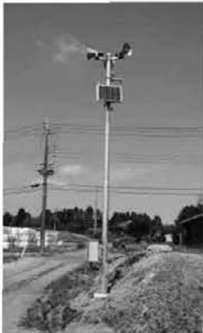
簡易屋外拡声子局(上川局)