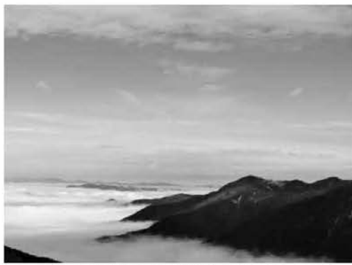
▲夏場は美しい雲海が見られる