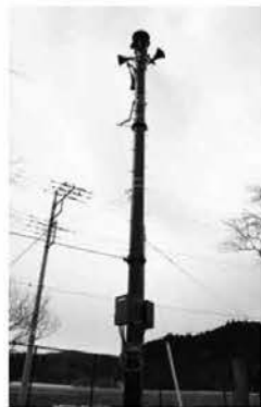
屋外拡声子局(芦野局)