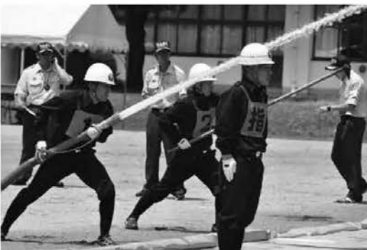
小型ポンプ操法の部準優勝 第4分団第3部(新田)選手の皆さん

平日にマイナンバーカードの受け取りができない方は、次の日程で休日窓口を開設しています。必ず予約願います。 ▼期 日 8月27日(土)、9月24日(土)、10月29日(土) ▼時 間 午前9時～午後0時15分まで ▼場 所 住民生活課 ▼問合せ 住民年金係 ☎76908