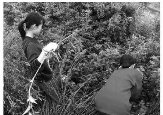
▲オオハンゴンソウを駆除する那須高校生

行政機関のほか、自然公園指導員、山岳会など関係者の皆さんとの協働により、山を守る取り組みをしています。