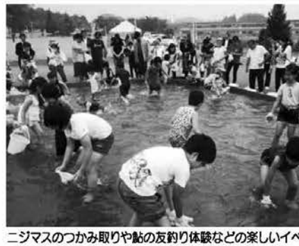
ニジマスのつかみ取りや鮎の友釣り体験などの楽しいイベントに子どもたちは大はしゃぎ(7/2 川は友だち〜川の日制定20周年記念〜 糸ヶ川ふれあい公園)