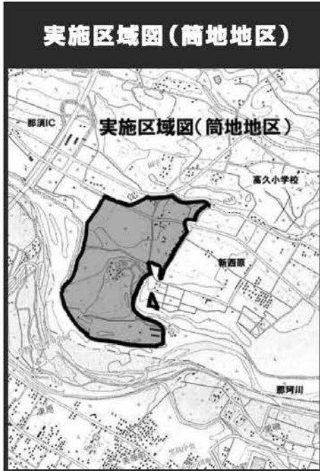
実施区域図（筒地地区）

地籍調査は、皆さんの大切な土地を保護するためのものです。境界確認の立会いで設置された一本の杭の測量成果は、今後、永久に皆さんの生活の基盤となる重要なものとなります。