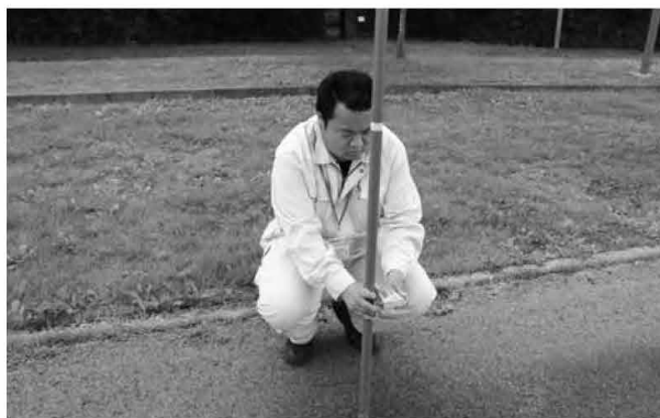
放射線量測定の様子