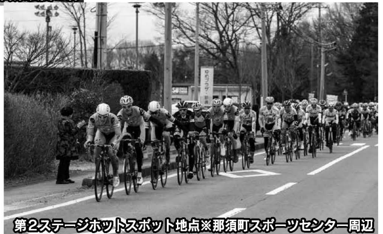
第2ステージホットスポット地点※那須町スポーツセンター周辺

第1回ツール・ド・とちぎの第2ステージは茂木町から那須町までの102km。 真冬のような寒さの中、レースは開催されました。