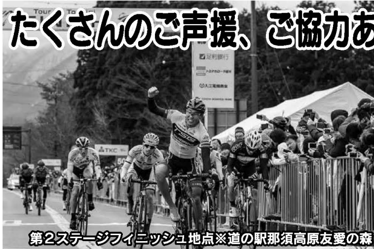
第2ステージフィニッシュ地点※道の駅那須高原友愛の森