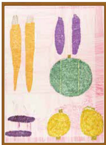
「つながるひろがるアート展Nasu」から タイトル『いろいろな野菜』