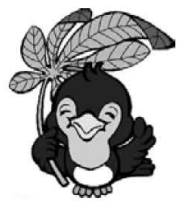
▲県民の日マスコット「ルリちゃん」

県では、郷土への理解と関心を深めること等を目的に、6月15日を県民の日と定めています。