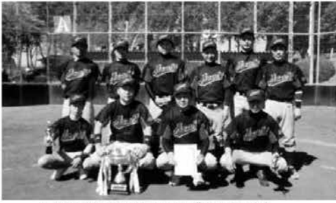
優勝に輝いた朝日クラブのみなさん