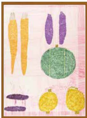
「つながるひろがるアート展Nasu」から タイトル『いろいろな野菜』