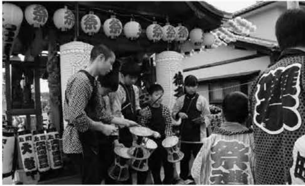
伊王野温泉神社付け祭り(昼)

毎年11月2日・3日に開催されている伊王野温泉神社例祭付け祭りの歴史は古く、これを後世に継承するため、同保存会は囃子保存会を結成し、年間を通して週1回の練習を行っています。小学生か