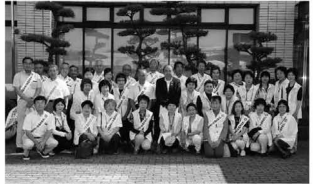
活動する保護司会、更生保護女性会の皆さん