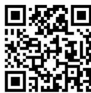
QRコードは(株)アンソーウェブの登録商標です。

お持ちの携帯電話等から「Enast@sg.m.jp」あてに、空メールを送信してください。QRコード対応機種であれば、左のQRコードを読み取ってアクセスしてください。