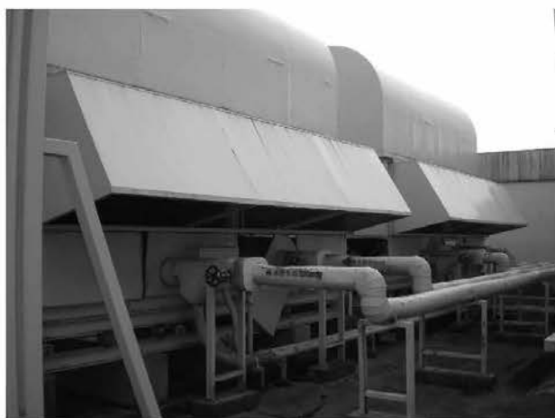
全損した空調機熱源用チラー

その他の設備については、重要書庫内の電動式移動ラックが揺れにより全損し、新規入れ替えを実施した（工事費、約2,000万円）。