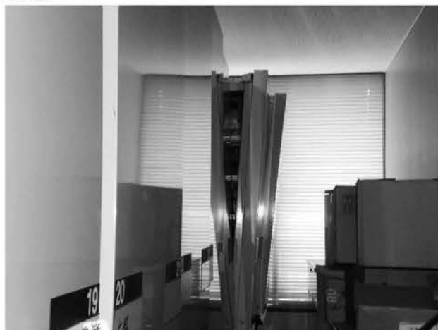
重要書庫内の電動式移動ラックも全損

庁舎周辺の被害としては、黒田原小学校校庭に隣接する庁舎東側駐車場の擁壁の一部が損壊し、復旧工事を実施した。（工事費、約220万円）