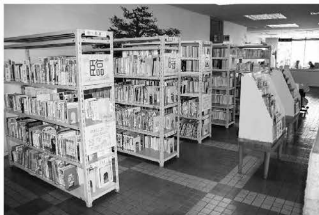
役場1階ロビーに開設された臨時図書館