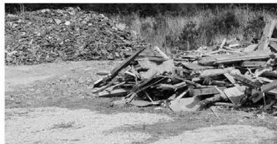
矢ノ目町有地に仮置きされた瓦類や木くず