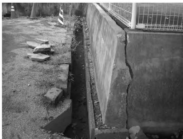
庁舎東側駐車場の擁壁の一部が破損

また、いこいの広場内にある戦没者慰霊碑が一部損壊し、部分的な修復を実施した。（工事費、約20万円）