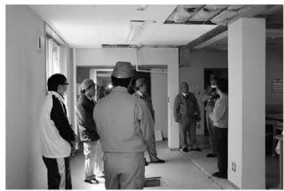
被害状況の説明を受ける議員（高齢者福祉施設）