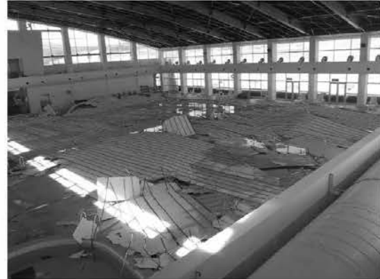
天井板が落下した那須スイミングドーム

復旧工事費総額は約1,720万円を要し、7月末にすべて完了し、8月12日に再オープンした。