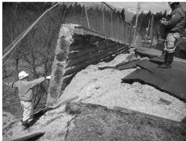
被災規模の大きかった旧黒田浄水場

配水管や給水管の復旧については、職員等によるパトロールや利用者からの連絡により、随時修繕工事を実施したが、箇所数が多いこともあり、工事が一段落するまでには4月末まで要した。