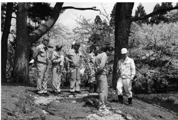
破損した遊歩道の被害調査（高久愛宕山公園）

また、放射性物質汚染対処特措法に基づく除染等の実施に対する財政措置及び除染方法等について、地方自治法第99条に基づき意見書を国の関係機関に提出するなどの対策を講じている。