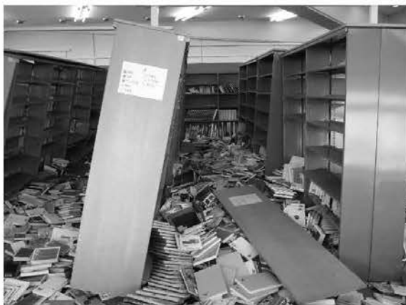
書籍やCDなど約11万点が床に散乱