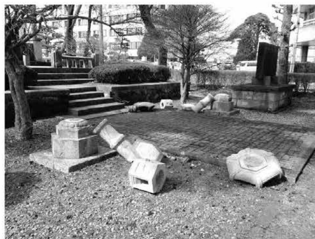
倒壊しいこいの広場内の石灯籠

役場庁舎については復旧まで約1年を要し、庁舎東側駐車場が工事用スペースとなったため、各課当番制により駅前駐車場を利用した。なお、災害復旧費は総額で約1億9千万円であった。