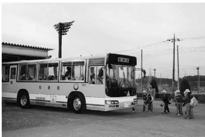
町スクールバスで朝日小学校に通う児童

初めは、地震の恐怖と慣れない環境で不安を抱える児童も多かったが、朝日小学校の児童や、黒田原中学校の生徒たちが日々温かく受け入れてくれたので、その不安も徐々に解消されていった。