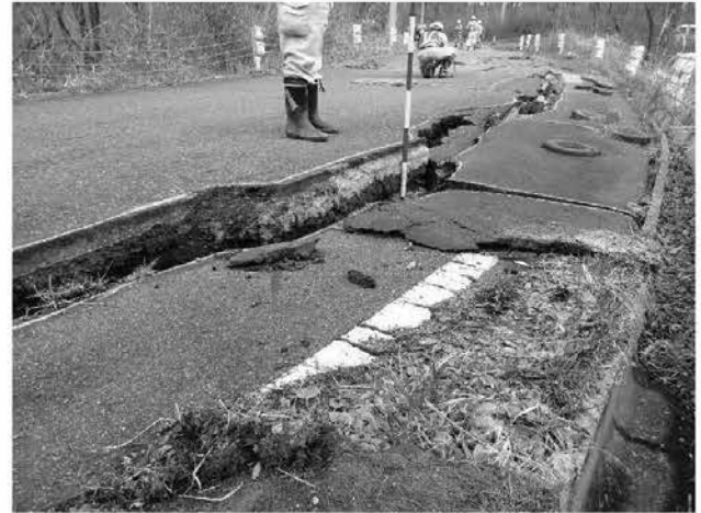
被災した町道の迅速な復旧に努めた