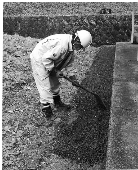
除染費用は国の補助