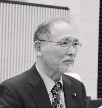
環境課長 除染してない場所