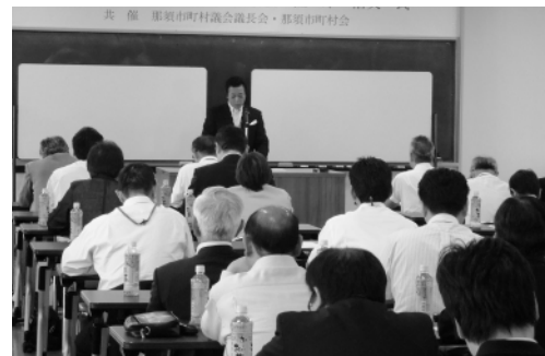
9月30日那須市町村議会議長会勉強会 (那須地区広域研修センター)