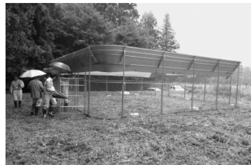
8月17日産業建設観光常任委員会 (猿捕獲巨大わなの現地視察)