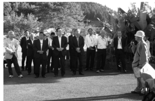
10月2日那須地区議員交流会 (芦野地内歴史散策)