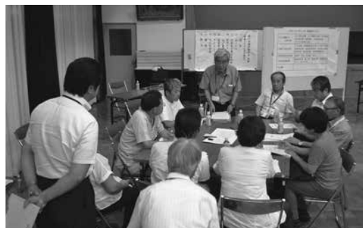
進め方を説明する座長