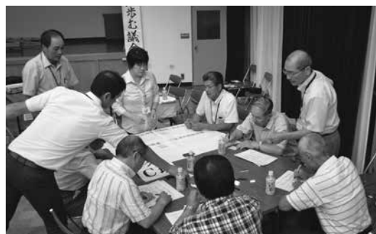
自分の要望等を考える