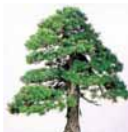
町の木 ゴヨウマツ